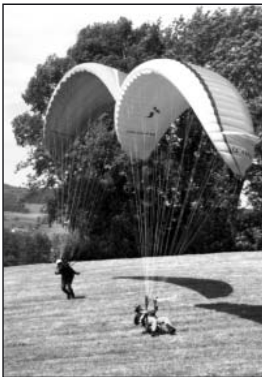
Stage "perf": exercice de maîtrise, debout et au sol

Et j'enroule, le long du parc aux biches, et j'enroule au-dessus du village où je