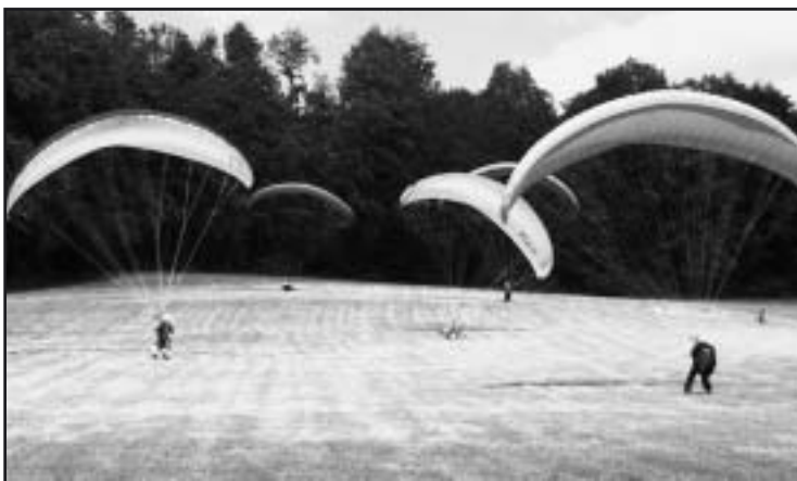
Stage "perf": une bonne partie de l'équipe en pente école

V endredi, déco de Gürli dans une bise plus que rafraîchissante, bien en face. Et même avec la combi, je grelotte! Ciel rempli de nuages à ras les sapins, je me demande si on va se faire taper juste pour un tout droit, direction attéro.