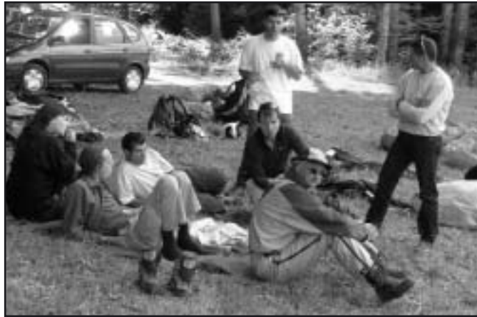
Stage "perf": une petite pause pour sécher les T-shirts