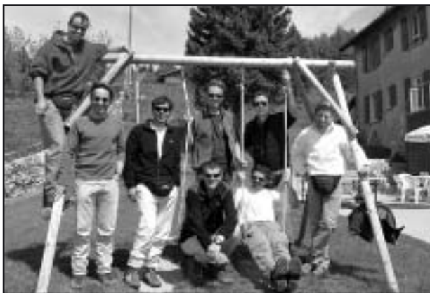
Stage "cross" à Mauborget devant chez Lulu

C'est à 58 km/h que le village de Treyvaux défile sous mes fesses. Arrivé à 1100 m d'altitude mon parapente se tend. Je zérotte... En planant vers les rochers de la Sarine, je coupe un thermique.