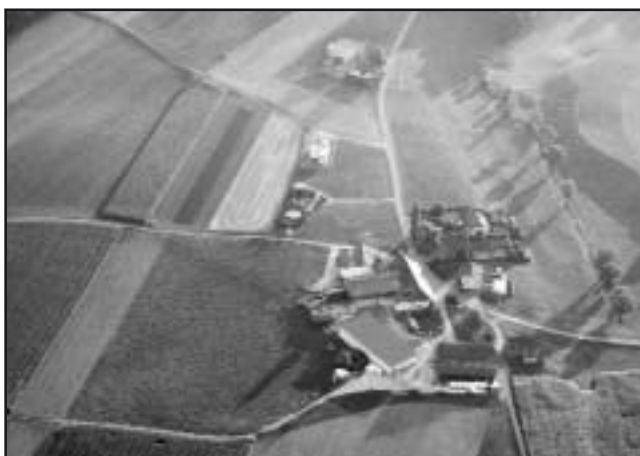
L'observatoire vue du ciel