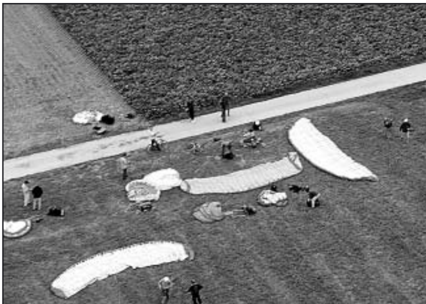
Installation de l'équipe dans la plaine de l'Orbe

Après le dévidoir fixé sur le toit de la Jeep nous montant jusqu'à 200 mètres, le treuil fixe est intallé pour faire des sauts de puce. Puis, à l'aide d'un dévidoir fixé sur une vieille moto