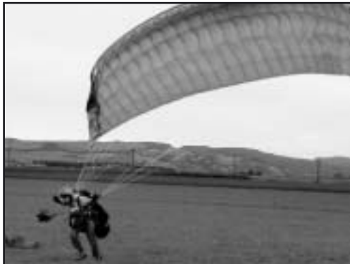
Paricia: décoller en tracté, c'est comme le vélo, ça ne s'oublie pas!