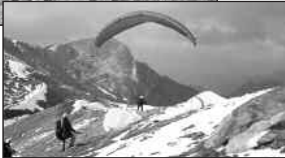
Exercice de contrôle de voile aux Merlas durant les stage F&F