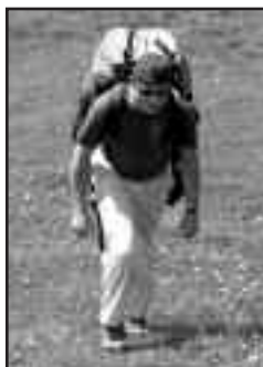
Vue d'en haut

discours et après nous le déluge sur les pentes du Chassera!!)