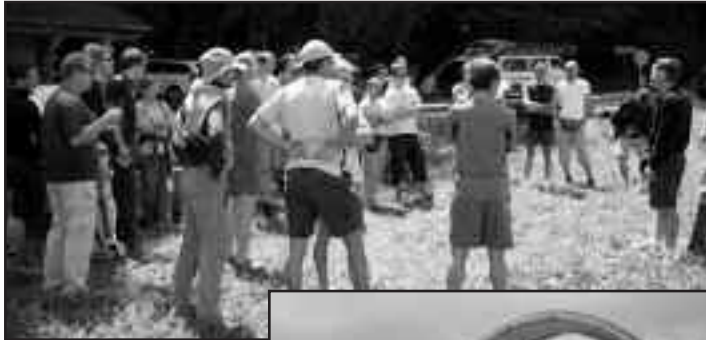
Briefing au concours interne avec les Albatros