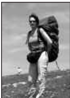
Vue d'en bas